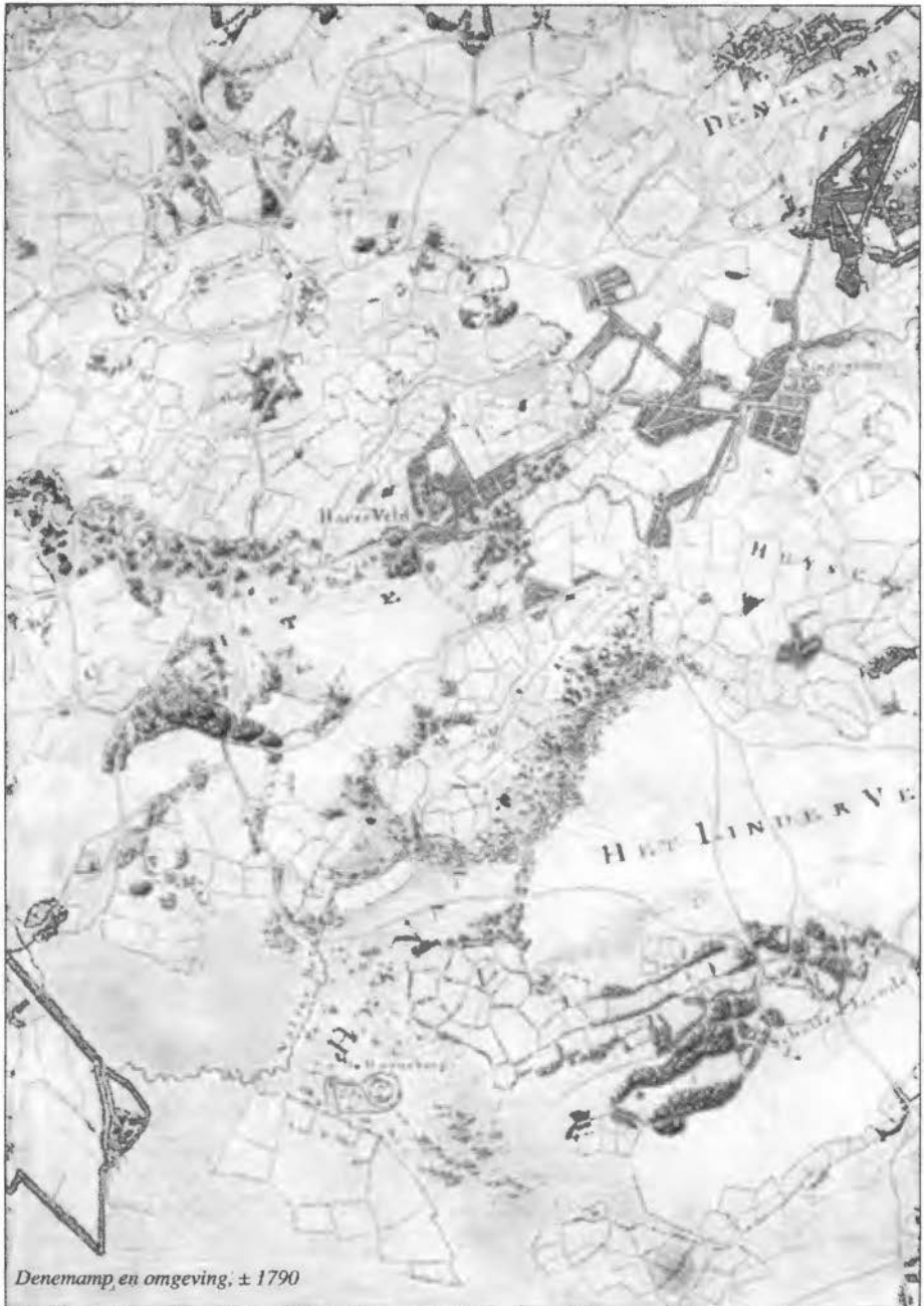
Denemamp en omgeving; ± 1790